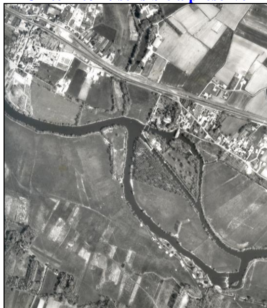
Un patrimoine naturel en héritage

Les prairies de la Baine présentent des enjeux faunistiques et floristiques notables.