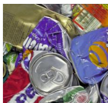
Centre de tri